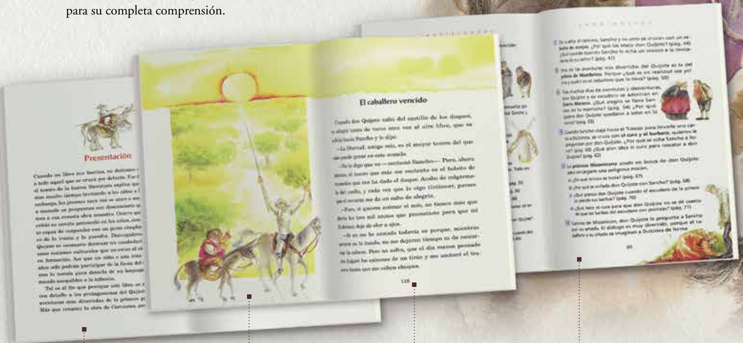
Presentación / Prólogo en todos los libros